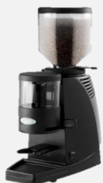
เครื่องบดกาแฟ