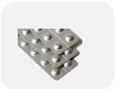
เบ็ดล้างทำความสะอาด