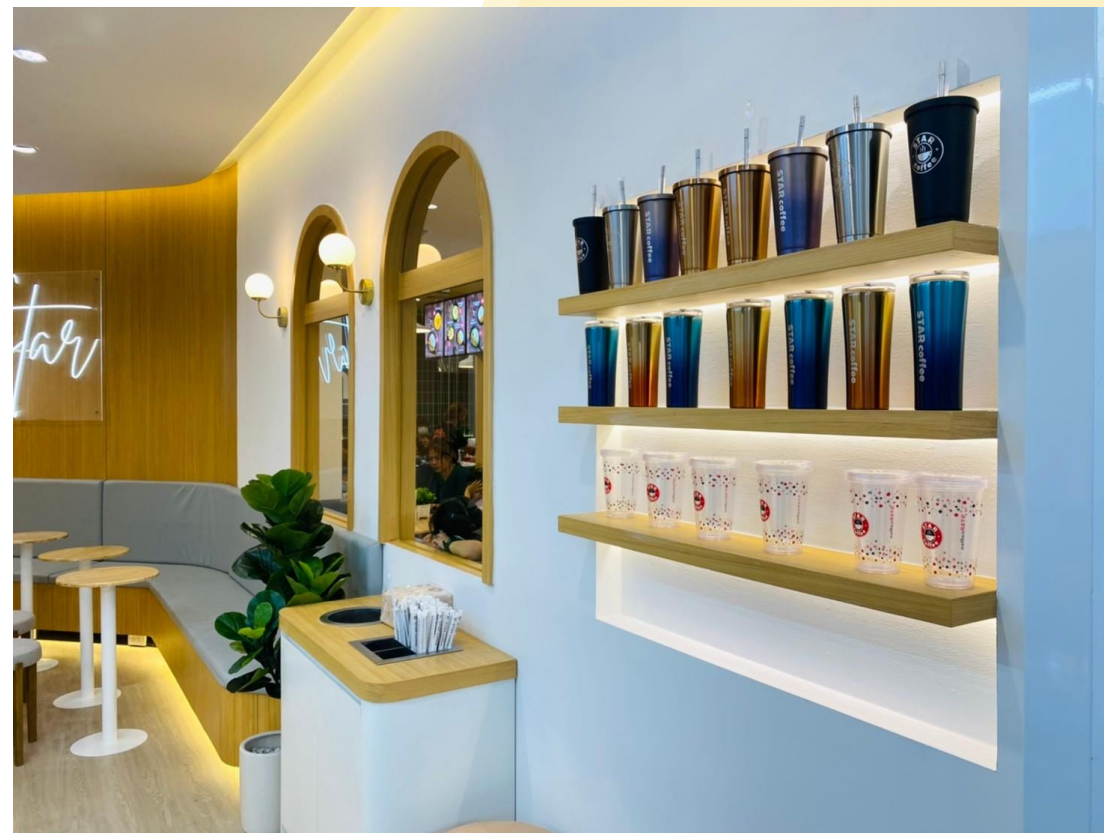
สาขา โรงพยาบาลเปาโล สະพานควาย