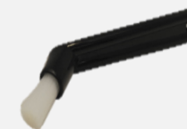
แปรงล้างอุปกรณ์