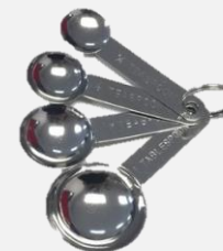
ชุดช้อนตวง 4 ขนาด