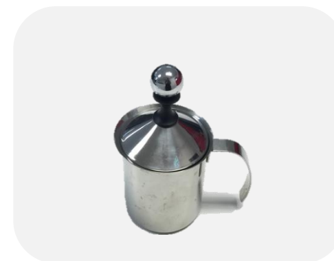
ถ้วยสตรีนมทรงเหยือก 0.6 L