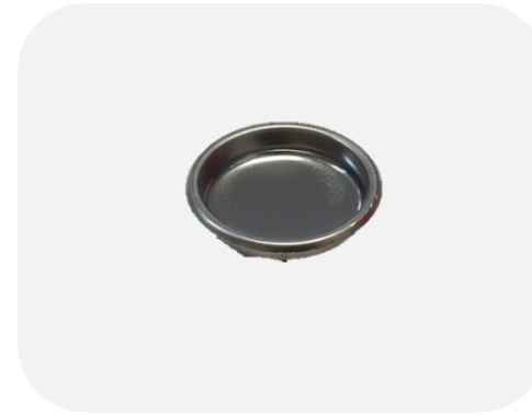
ซิปตันล้างหัวชง 2.5