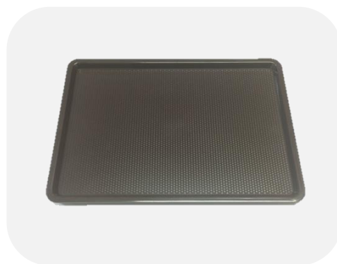
ถาดเสิร์ฟ ABS สีน้ำตาล T119