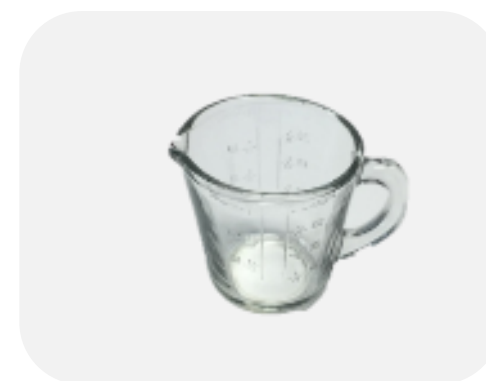
แก้วตวง 8 Oz