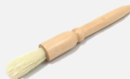
แปรงปิดกาแฟ12.5cm.