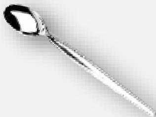
ช้อนโซดา 20.2 cm.