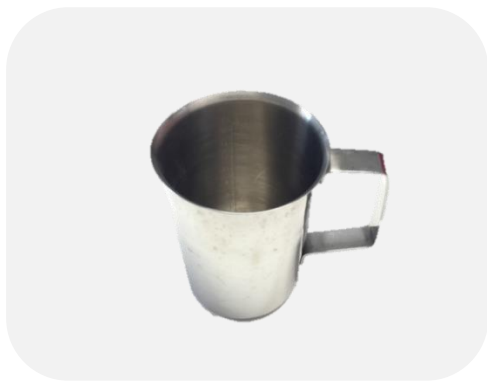
ถ้วยสตรีนมทรงเหยือก 0.6L