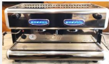
เครื่องชงกาแฟ