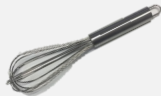
ตะกร้อตีมือด้ามสแตนเลส24cm