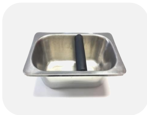
อ่างเคาะ