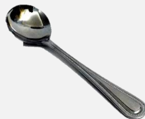
ช้อนสำหรับตักฟองนม