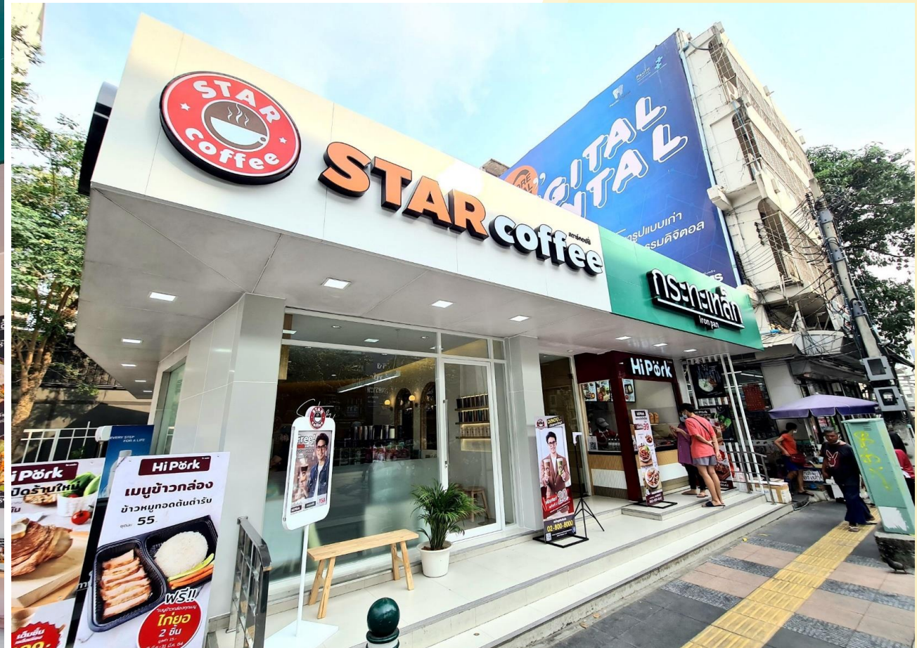
สาขา โรงพยาบาลเปาโล สะพานควาย