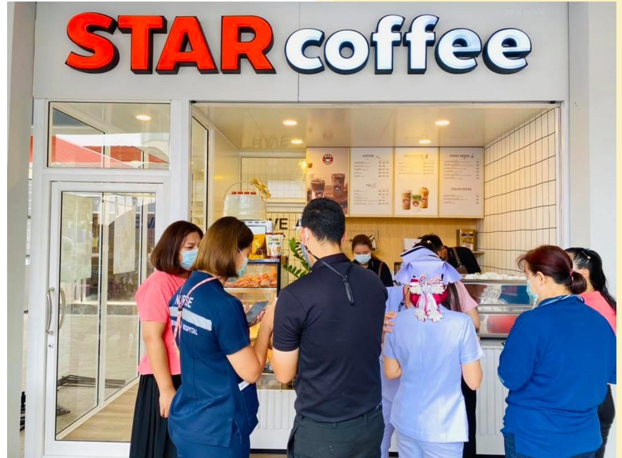
สาขา โรงพยาบาลฟาง จ.เชียงใหม่